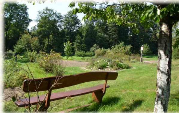
Garten der Besinnung

Das an christlichen Grundwerten orientierte Behandlungskonzept bietet die Möglichkeit Fragen nach dem Lebenssinn und dem persönlichen Glauben mit einzubeziehen.