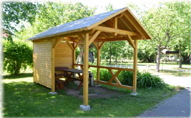
Fachwerk aus eigener Produktion

Dazu gehören das Therapiehaus in Hermersdorf und weitere Häuser, die nach der Therapie verschiedene Möglichkeiten des Wohnens und der Begleitung bieten.